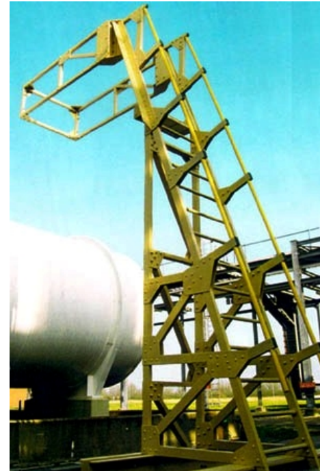
Verfahrbare Leiter zur Be-/Entladung von Tankfahrzeugen in der Chemieindustrie